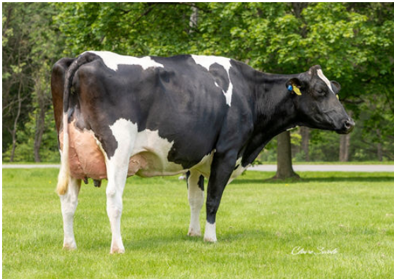
AURORA PERFECT 23719