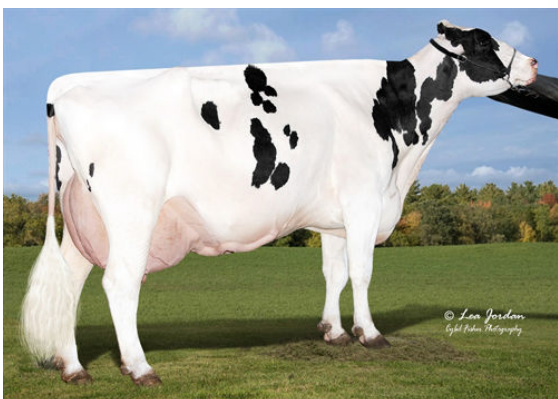
AURORA DOORSOPEN 17054