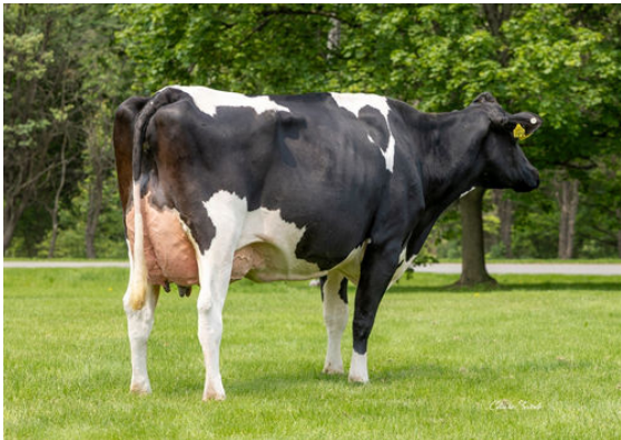
AURORA PERFECT 23719